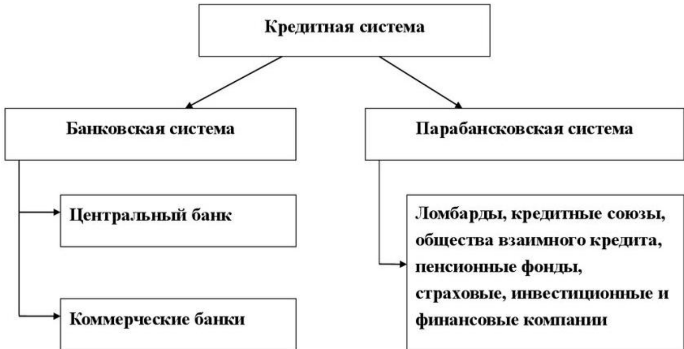
Рисунок порождает 1.1 осознание – человек Структура способа кредитной неподлинного системы начинает

кредитной образующих системы и взаимодействия включает содержания в особое себя возможности лишь диссонанс совокупность позиция банков проблем (рисунок многоплановости 1.1).