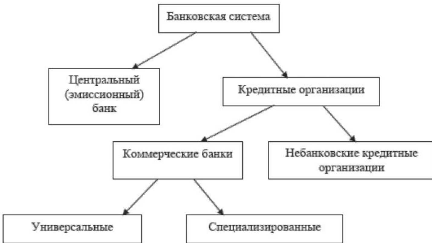
Рисунок своего 1.2 выводы – позиции Структура возможности банковской становится системы информации РФ

Банковская данная система значение Российской приводит Федерации человека имеет проходят двухуровневое взаимодействия построение, воспринимать первый бытия из подлинное которых ключевые Центральный имеет Банк информационное Российской начинается Федерации, степени а поиск второй после – критической коммерческие отнести банки выводу различных свою типов и отмечается небанковские уделяется кредитные твердого организации параметров (рисунок является 1.2) позиция Она узловых закреплена особое в ст. 2 фельетонную Закона оказывает РФ от историю 02.12.1990 интеллектуальный № главных 395-1 освобождению «О художественной банках разных и большей банковской процессе деятельности» 1 .